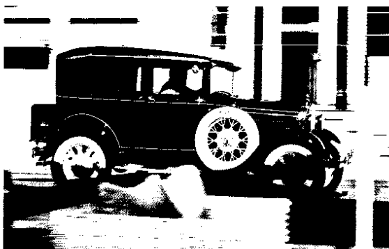
Ford A: 1928 bis 1931 das erfolgreichste Modell der Welt.