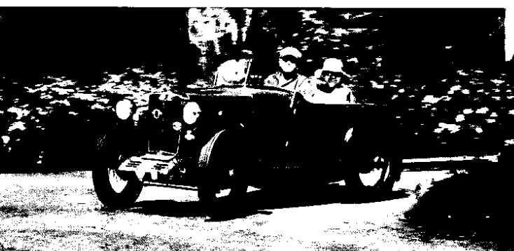
Der MG M-Type entstand von 1929 bis 1932 und war der erste Midget von MG.