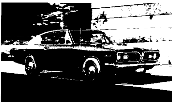
Plymouth Barracuda 440, mit dem 5,2-Liter-V8-Motor.