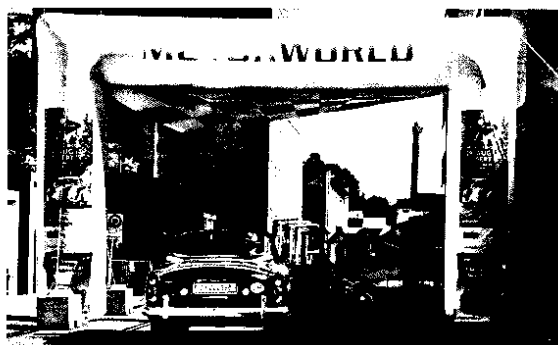
Am 8. September heisst es zum letzten Mal dieses Jahr «Willkommen zur Older Classics in Kempththal».

Text: Jürg Zentner